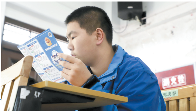
▶ 学生正在阅读宣传手册

此外,现场设置了法律咨询点,发放未成年人法律知识答题、《民法典》等相关法律法规宣传资料500余份。 接下来,宣讲活动还将在七星关区、威宁自治县、金沙县等地7所学校开展,以此增强学生“学法、守法、用法”的意识,培养学生法治思维。