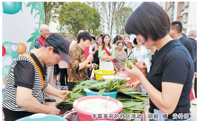
丰富多彩的社区活动

本报讯(记者 张黎)“陌生电话要警惕,可疑短信需注意”“邻居很久不在家,帮忙照看人”……11月22日,记者在七星关区归化街道同德社区文化墙上看到,一条条宣传