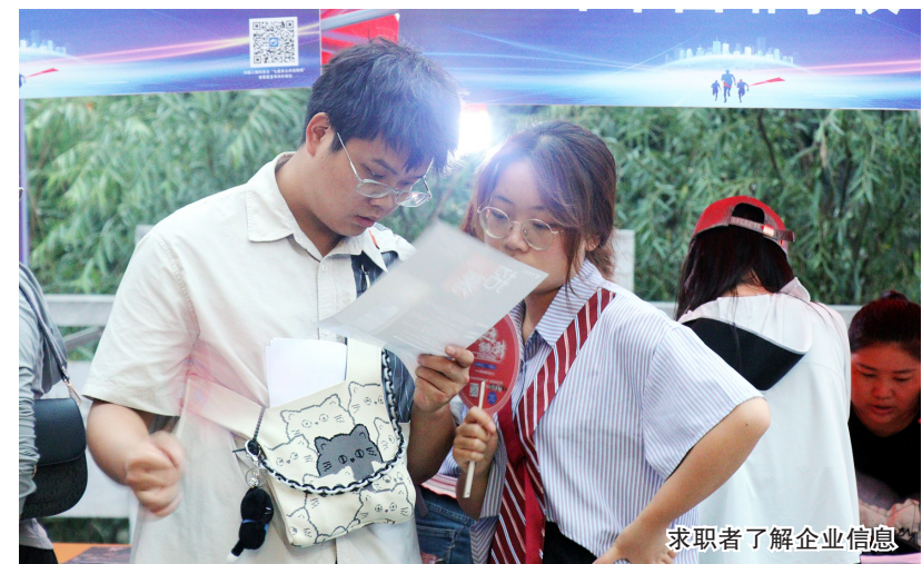
求职者了解企业信息

本报讯(刘成洁 刘晓颖报道)8月18日,七星关区人力资源和社会保障局巧借“花海毕节·清凉狂欢夜”音乐节举办的契机,开展高校毕业生专场招聘会。招聘会现场,人潮涌动。求职者向招聘企业详细了解企业信息、工作概况、薪资待遇等情况。同时,七星关区人社局工作人员向企业和求职者提供政策解读、发放就业创业政策手册等服务。“我们正在找工作,得知这里