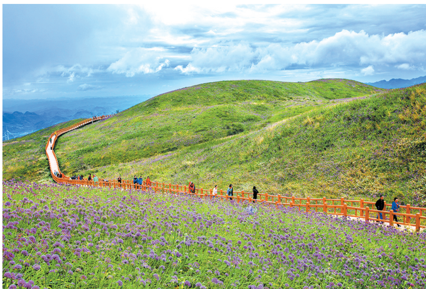
游客在韭菜坪景区赏景

两手都要抓,两手都要硬。下一步,毕节将坚持以高质量发展为统领,以文旅深度融合为核心,围绕旅游及相关产业附加值、游客人均花费两大提升目标,聚焦资源、客源、服务三大要素,充分发挥政策、资源、人口“三大优势”,全面落实市委“1+6+1”政策措施,扬优势、补短板,加快推动旅游产业化高质量发展。