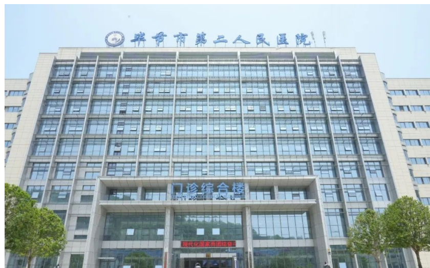
毕节市第二人民医院

5年内,让毕节多一家三级甲等医院。”王刚说,接下来该院将努力在院管理、医疗质量、服务水平、学科