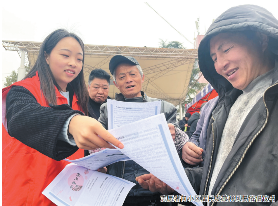
志愿者们向小区居民发放移风易俗倡议书

本报讯 (李娟报道)近日,黔西市文峰街道以倡导文明新风、抵制滥办酒席,倡导勤俭节约、抵制大操大办,倡导文明婚俗、抵制高价彩礼,倡导敬老爱老、抵制厚葬薄养,倡导科学文明、抵制封建迷信,倡导健康生活、抵制“黄赌毒”,倡导党员带头、发挥示范引领“七个倡导”为主题,大力开展“推进移风易俗、树立文明新风”文明实践及宣传志愿服务活动。 活动开展以来,通过知识问答、转发移风易俗倡议书网络宣传链接、到社区广场发放倡议书及现场讲解等形式,引导群众从现在做起、从自身做起,移风易俗、厉行勤俭节约、弘扬时代新风,共同建设文明家园。有效提高了辖区群众对移风易俗工作的知晓率,营造了“创文”的良好氛围。 下一步,文峰街道将创新工作举措,开展“源头管控、对症下药”,压紧压实责任,形成层层负责、上下同心的工作格局,切实整治滥办酒席、高额彩礼、厚葬薄养、铺张浪费等不良习俗,持续推进精神文明建设。