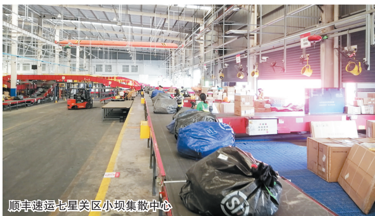
顺丰速运七星关区小坝集散中心

本报讯(记者 彭静)11月11日,顺丰速运七星关区小坝集散中心,工作人员各司其职:消杀、分拣、装车,准备将客户的快件送往全市各地。