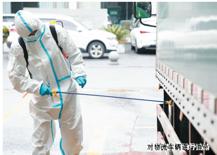
对物流车辆进行消杀