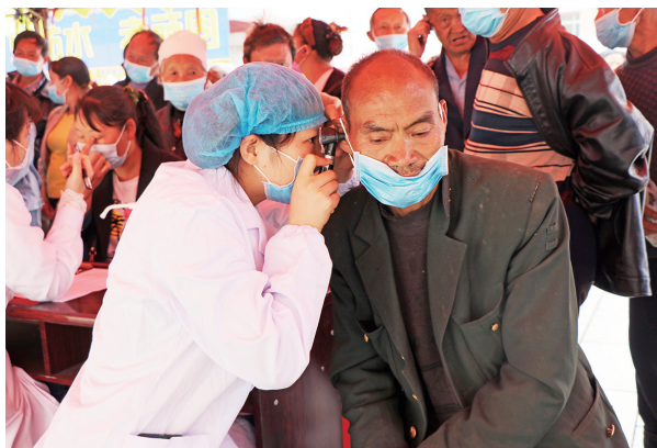
近日，由织金县卫生健康局主办，贵州医科大学附属医院织金分院（织金县人民医院）承办的“贵在有你·医者仁心”大型义诊活动在该县龙场镇文化广场启动。