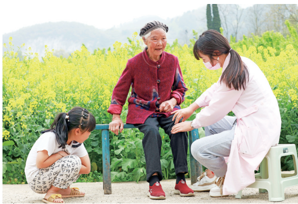
3月20日，家庭医生走进黔西市协兴镇化甲社区，给村民测量血压、血糖、心率，提供健康指导等。