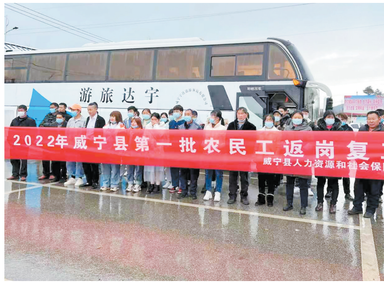
2月6日,威宁自治县第一批56名返岗农民工,有序踏上了免费开往广州市番禺区的的大巴车。

家庭开展大走访活动,及时掌握就业状况和就业创业帮扶需求,动态掌握全县数据,为岗位推荐、劳务输送提供数据保障。同时,积极协调省内外各部门和企业到该县开展务工招聘,为困难群众搭建平台送岗位、精准开展培训送技能、组织返岗送服务,全力为城乡劳动人员提供精准、优质、高效的就业服务。