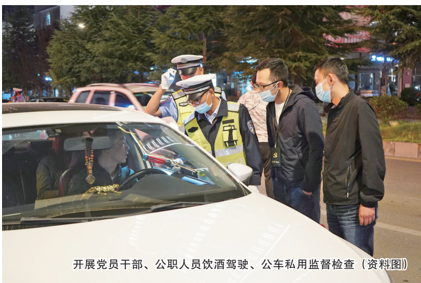
开展党员干部、公职人员饮酒驾驶、公车私用监督检查（资料图）

百年流光，忆往昔初心不改；万里征途，立当下迈步从头。 2021年，在贵州在毕节发展史上是具有里程碑意义的一年。去年春节前夕，乌江畔化屋村，习近平总书记的重要讲话和亲切关怀鼓舞着全市广大党员干部和人民群众。 在“两个百年”交汇、“十四五”全面开局之际，一年来，毕节市以习近平新时代中国特色社会主义思想为指导，在贯彻新发展理念示范区建设之路上昂首阔步，在全面从严治党征程上砥砺前行。衷心拥护“两个确立”、忠诚践行“两个维护”，围绕“四新”主攻“四化”、聚焦“三新一高”，市委统揽全局、协调各方，落实管党治党责任从严从实，全市各级纪检监察机关坚决履行党章和宪法赋予的职责，全面从严治党向纵深推进。 答好时代之卷，接受人民阅卷。2021年全市人民群众对党风廉政建设和反腐败工作成效满意度创下历史新高，95.44%，全市政治生态持续向好向善巩固发展。