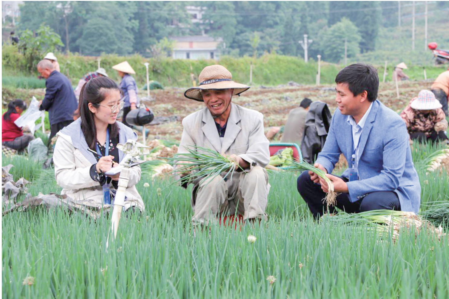
深入田间地头开展监督检查（资料图）