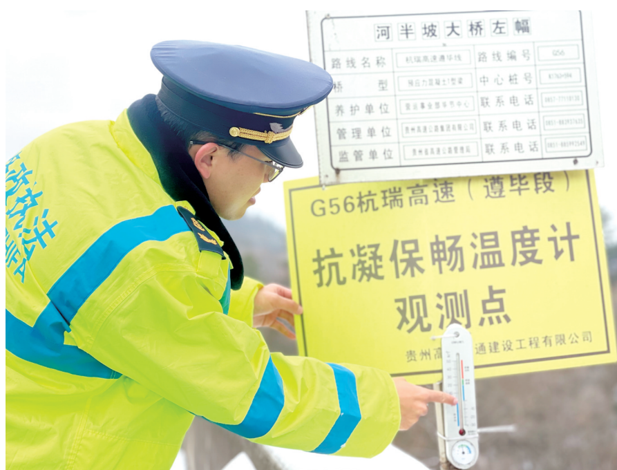
工作人员正在观测温度 ▶