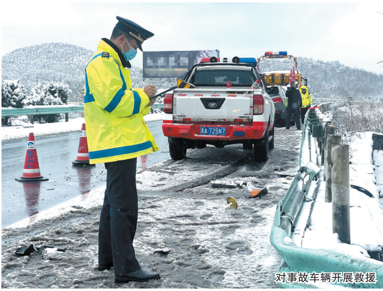
对事故车辆开展救援