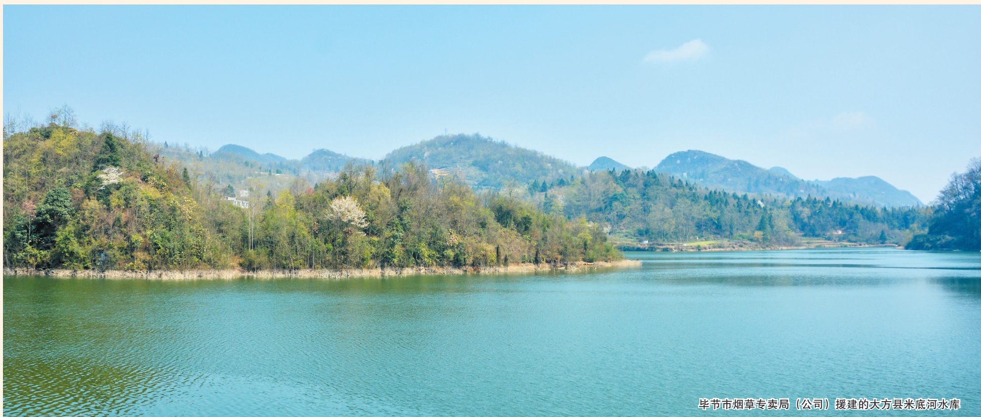
毕节市烟草专卖局(公司)援建的大方县米底河水库

与贫困决战，与全国实现同步小康，这是生活在这片土地上广大群众共同的愿望。在决战贫困这场没有硝烟的战役中，毕节市烟草专卖局(公司)不遗余力，积极发挥烟草产业的带动优势，帮助困难群众走出贫困、走向幸福，践行了央企的使命和担当。