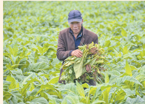
群众清除烟田里的杂草