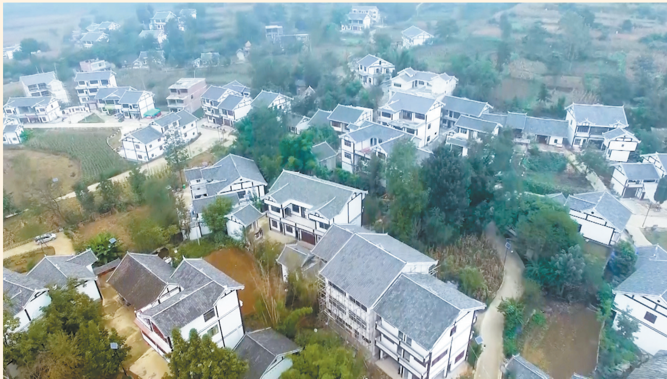
毕节市烟草专卖局(公司)援建的美丽新村——百里杜鹃管理区大堰村