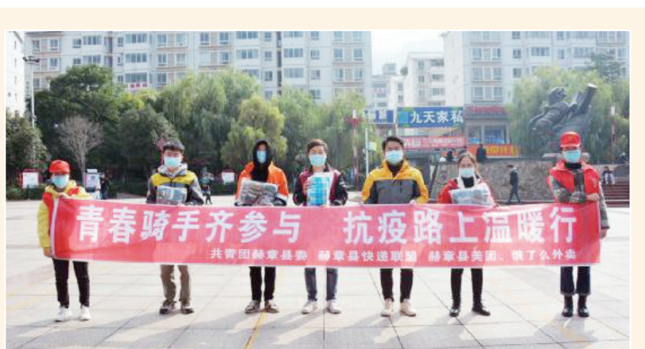
近日,共青团赫章县委联合县卫健局发动快递联盟、外卖平台,开展“青春骑手齐参与·抗疫路上温暖行”疫情防控志愿服务活动。200余名快递员、外卖员在各团组织的带领下变身防疫宣传员,将4000余份宣传手册送到居民手中。

毕节市交通运输集团有限责任公司提醒市民,前往客运站乘车时,请积极配合客运站工作人员落实好实名制购票、体温检测、“两码”查验,规范佩戴口罩等防疫措施,安全出行。