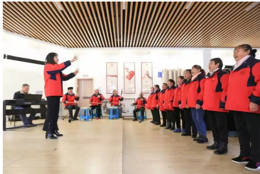
柏杨林街道老年合唱队

七星关区柏杨林街道是我市单体规模最大的易地扶贫搬迁安置点，搬迁群众涉及七星关区34个乡镇（街道）共6372户，共有19个少数民族共4310人，占总人口的14.6%。自2019年4月成立以来，该街道始终以党建为统领，以服务为出发点，以发展为目的，不断加强服务与创新，促进各民族和谐发展，民族团结幸福之花竞相开放。