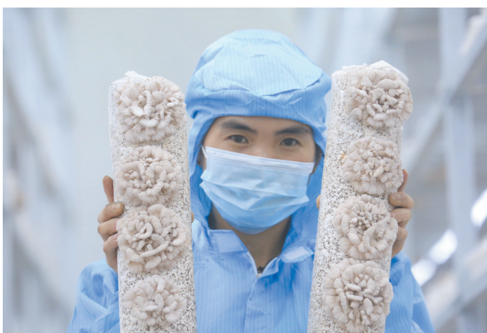
外形如花的白参菇