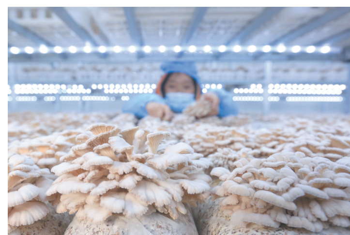
规模化统一管理、培植