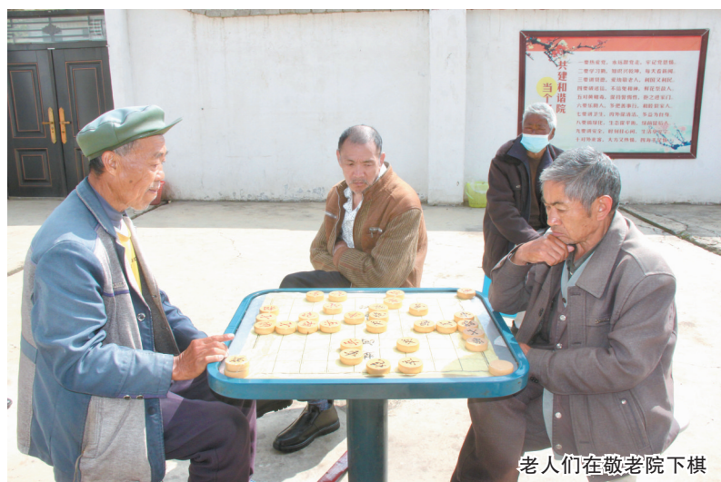
老人们在敬老院下棋

本报讯(李维炬报道)近年来,威宁自治县么站镇多措并举,不断加大孤寡老人等困难群众救助力度,重点做好集中供养等工作。