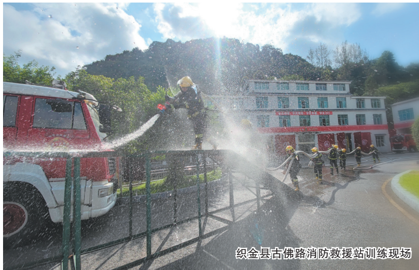
织金县古佛路消防救援站训练现场

着力打造“爱民消防”。全体指战员以高度的责任担当和使命感,自觉投入新冠肺炎疫情防控工作中,第一时间响应,并成立抗击疫情“党员先锋队”“青年突击队”,共出动指战员436人次,洗消车辆232车次、洗消面积共5万余平方米。2018年以来,长期结对帮扶慰问辖区孤寡老人和困难群众,捐赠物资5万余元,为群众送水500余吨。组建“红门乐队”,开展消防宣传活动,对外开放消防站,教育群众2.5万余人。