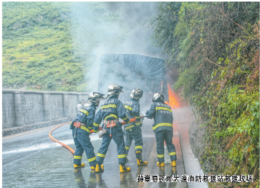
赫章县夜郎大道消防救援站救援现场

荣誉的获得既是褒奖更是鞭策,面对新的机遇和挑战,全体指战员将始终保持“心系百姓、服务社会”的情怀,以“对党忠诚、纪律严明、赴汤蹈火、竭诚为民”的时代担当,主动承担起防范化解重大安全风险、应对处置各类安全事故的重要职责,为辖区经济建设和保护人民生命财产安全作出更多更大贡献。